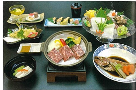
但馬フルコース極み御膳