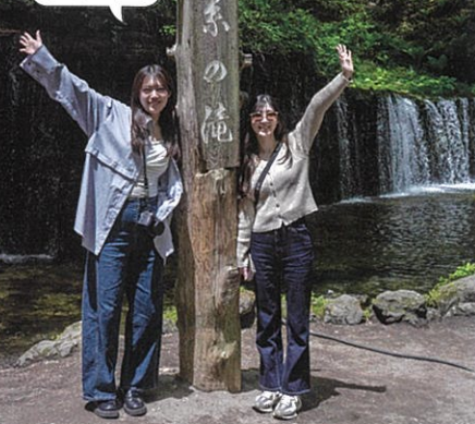
自然の癒しを チャージ!