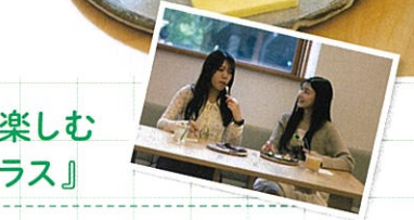
どれにするか迷うな~。