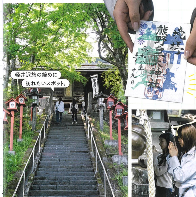
軽井沢旅の締め 訪れたいスポット。