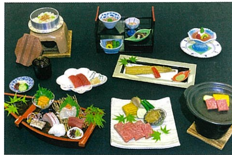
雲丹付き紀州舟盛りと熊本和王牛サーロイン陶板焼き極み御膳