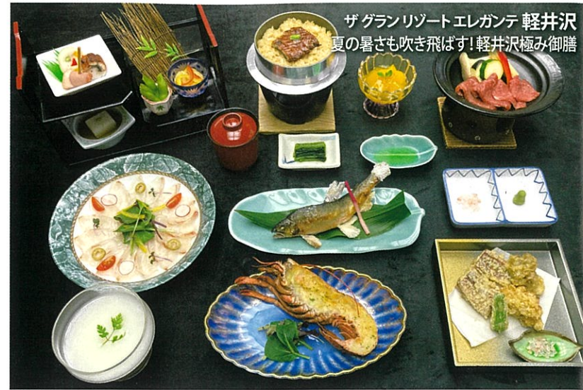
ザグランリゾートエレガント 軽井沢 夏の暑さも吹き飛ばす! 軽井沢極み御膳

※グループ単位でのお申し込みとなります。※写真の鍋物、お造りは3~4人前です。詳しくはお問い合わせください。※仕入れ状況により、献立が変更する場合がございます。ご了承ください。