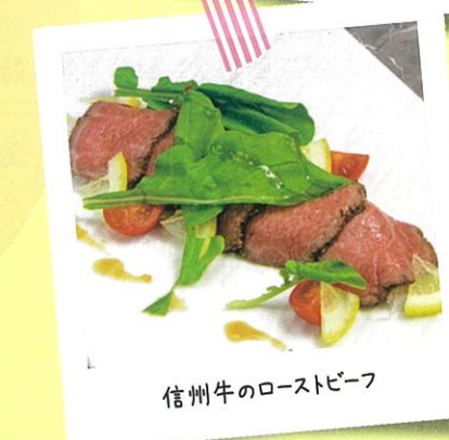
信州牛のローストビーフ