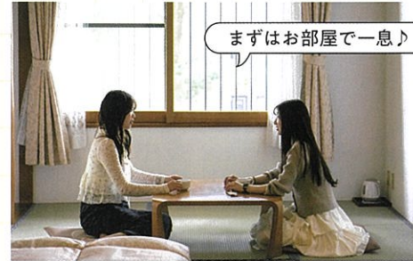
まずはお部屋で一息♪

緑に囲まれた閑静なロケーションに、落ち着いたタイル張りの外観が映える『ザ グラン リゾート エレガント軽井沢』。高級別荘地として知られる軽井沢らしい、クラシックな高級感を携えた林間リゾートホテルです。