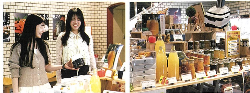
AIロボットがお出迎え！

ロビーまわりには、軽井沢らしい食品やドリンク、お土産が並ぶ売店コーナーも。美しく陳列された商品を眺めながら、滞在中のおやつや帰りのお土産を選ぶ時間も楽しいひととき。