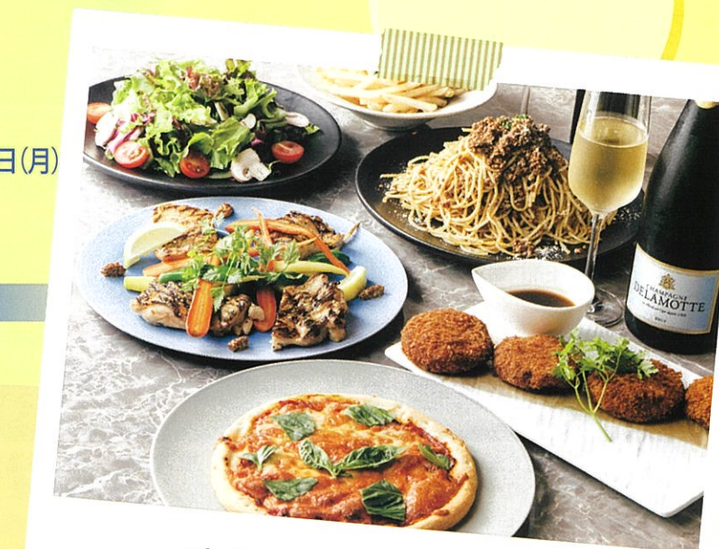
プレミアムコース (1名様) 10,000円(税込)