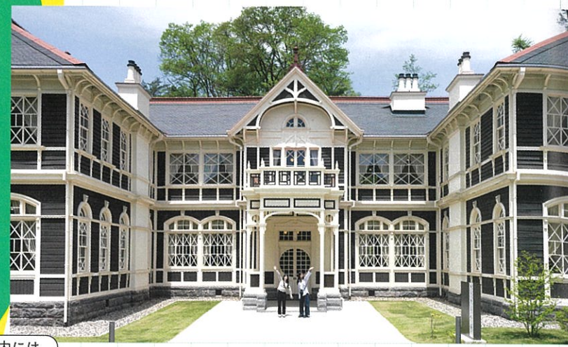
館内には、 カフェスペースも。

豊かな自然、歴史ある建築、アートミュージアムにカフェ&ショップなど。旅の途中に立ち寄りしたい、多彩な見どころが点在する軽井沢。ここならではの心地よい時間を感じられる、オススメのグッドスポットをご紹介します!