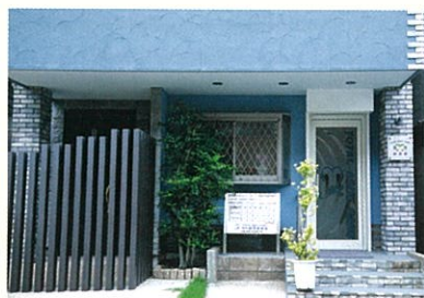
空色の壁面がおしゃれなエントランス。敷地内に駐車スペースもあるので、通院も便利です。