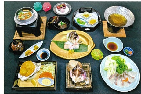
贅沢・焼とり貝とお造り・岩牡蠣極み会席