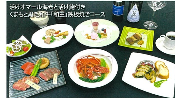
活けオマール海老と活け鮑付きくまもと黒毛和牛「和王」鉄板焼きコース