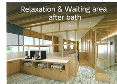
Relaxation & Waiting area after bath

落ち着いた和モダンのデザインを取り入れ、どのお部屋でもゆったりとした時間をお過ごしいただける空間へ生まれ変わります。また、照明にもこだわり、やさらかな間接照明が一日の終わりに安らぎをもたらします。