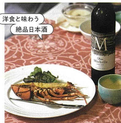
洋食と味わう 絶品日本酒

夕食時には、地元・佐々の酒蔵『伴野酒造』の日本酒もオーダー可能。『凜の花』や『Beau Michelle』など、信州の水と米から生まれる味わいをラインナップ。同ホテル料理長が手掛ける料理とお楽しみください。