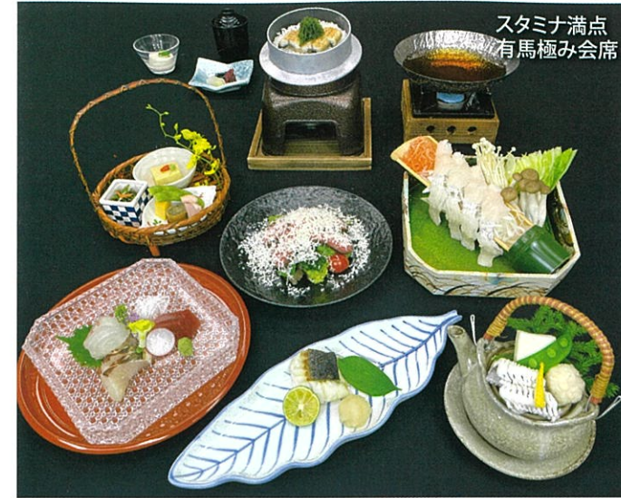
スタミナ満点 有馬極み会席