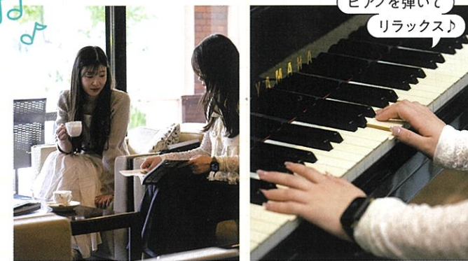
ピアノを弾いてリラックス♪

夕食後は、大浴場でゆっくり湯浴みの時間。広々とした湯船に浸かれれば、移動や散歩で少し疲れた体もじんわりリラックス。天然温泉ではないものの、本格的なドライサウナ付きなので、サウナーの方にも◎。