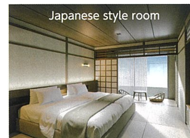
Japanese style room