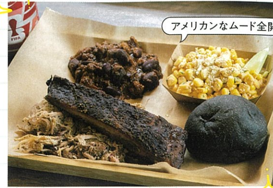
アメリカなムード全開!