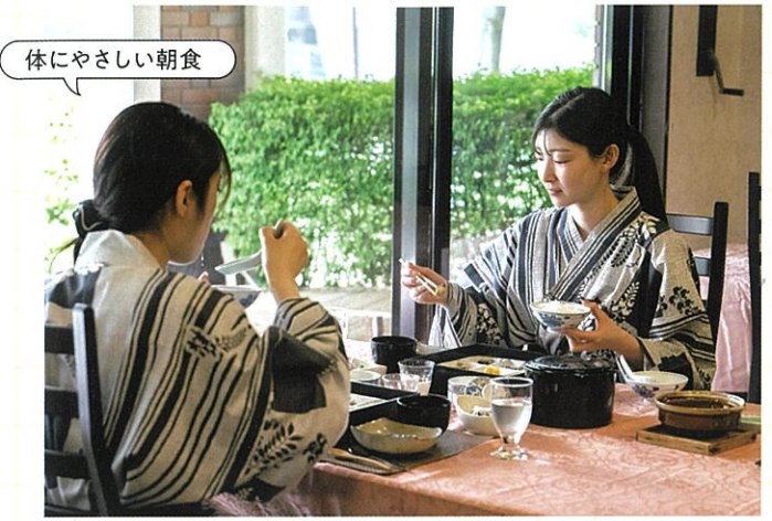
体にやさしい朝食

緑に囲まれた屋外席で過ごす時間は、朝の余韻をそのまま楽しめる気持ちよさ。敷地内には、テニスコートも併設。軽井沢の自然を感じながら体を動かしたい人にもぴったりです。