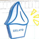
歩いているだけで癒される~。