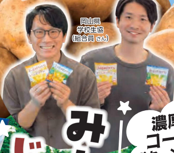
岡山県 学校生協 (組合員さん)