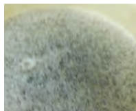
一晩寝かせ味をなじませたみりんと出汁