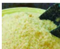
精製度が低く和菓子にも使われる三温糖