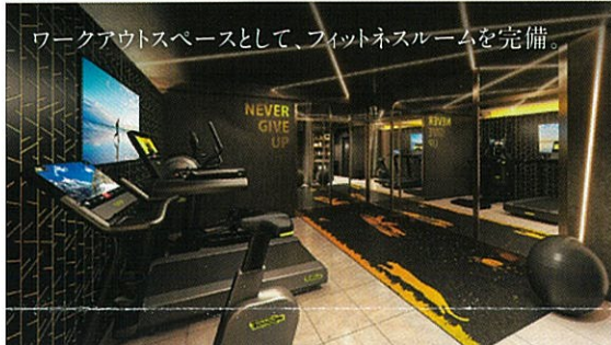
ワークアウトスペースとして、フィットネスルームを完備。