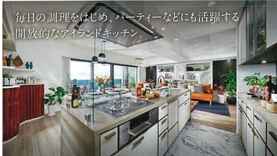
毎日の調理をはじめ、パーティーなどにも活躍する開放的なアイランドキッチン。