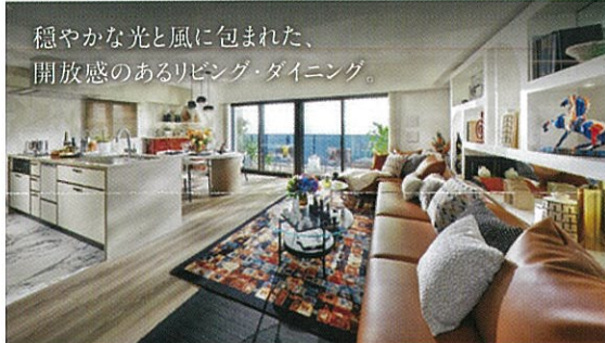
穏やかな光と風に包まれた、開放感のあるリビング・ダイニング。