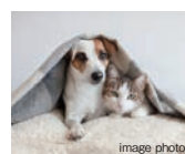
ペット可マンション ※ペットの種類・大きさ・頭数などには制限があります。